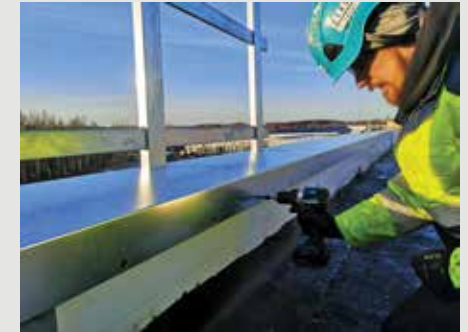
4. Kiinnitä rästääs sisäpuolelta jokaisesta kiinnityskohdasta.