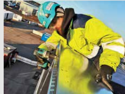
3. Kiinnitä räystääs ulkopuolelta jokaisesta kiinnityskohdasta.