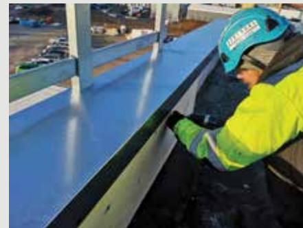
9. Asenna koolauksien päälle rakennuslevy.

Pelti-villa-peltielementtiin: kateruuvi 4,8 x 28 mm