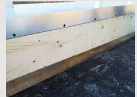
10. Asenna katon ja seinän liittymään kolmio- rima. Kermi asennetaan kaiteeseen saakka.