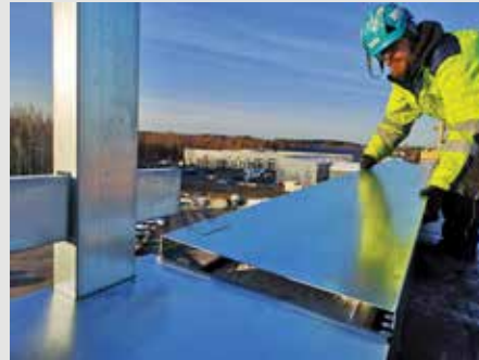
2. Aseta räystäsrakenne seinäelementin päälle. Huomioi 20 mm tuuletusväli seinäelementin ja räystään välillä.