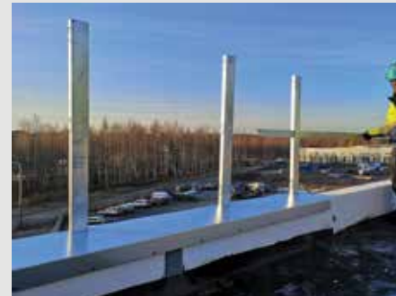
7. Aseta pystykaiteet. Kiinnitä vaakakaiteet toisiinsa jatkopalalla.