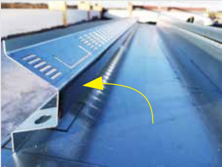
1. Laita reunatiiviste räystään ulkoreunaan.