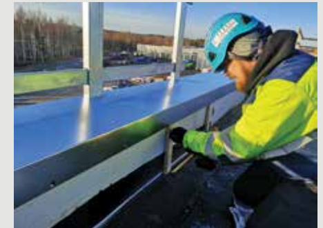
8. Tuulettuvissa räystäissä, asenna pystykoolaus esim. k600.

Huomioi ennen asennusta työturvallisuus - tarvittaessa käytä valjaita!