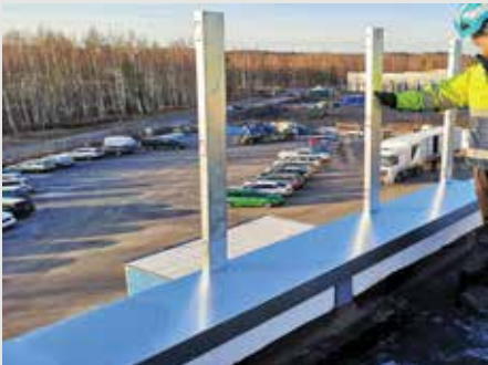
5. Aseta pystykaidetolpat.